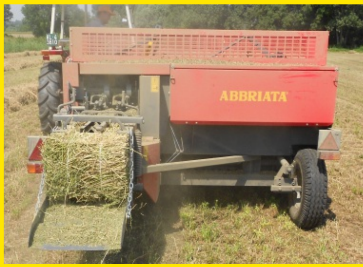
Vista posteriore della macchina al lavoro Rear view of the machine at work